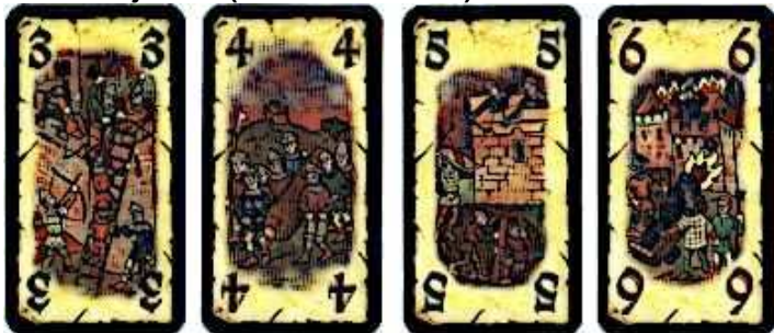
30 cartes 9 cartes 8 cartes 6 cartes