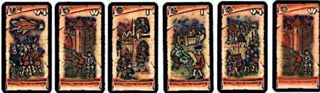
2 cartes Signe de Dieu 3 cartes Ingénieur 5 cartes Écorcheur 5 cartes Ambassadeur 5 cartes Retraites 1 carte Félon