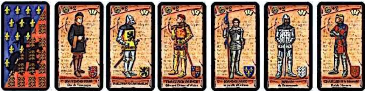
dos de toutes mauvais Jean Sans Peur Philippe Van The Black Prince Jeanne d'Arc Jean IV Charles II le Roi de Navarre toutes les cartes Duc de Bourgogne Artevelde Edward Prince of Wales d'Orléans de Beaumanoir