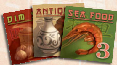
90 tuiles Commerce