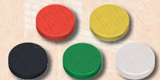
150 marqueurs Propriété (30 dans chacune des 5 couleurs)