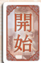
1 carte Premier joueur