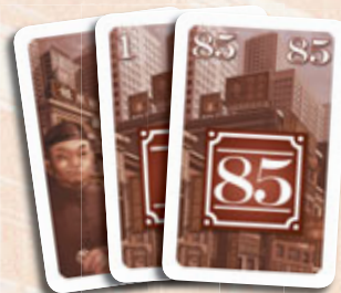
85 cartes Immeuble