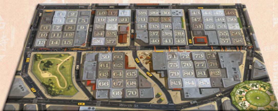
1 plateau de jeu