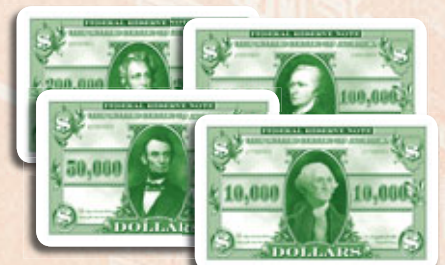
84 cartes Argent (réparties en billets de 10,000$, 50,000$, 100,000$ et 200,000$)